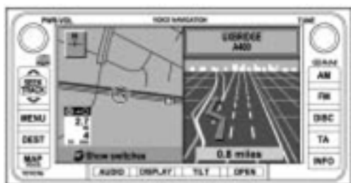
Навигационная система картографического типа